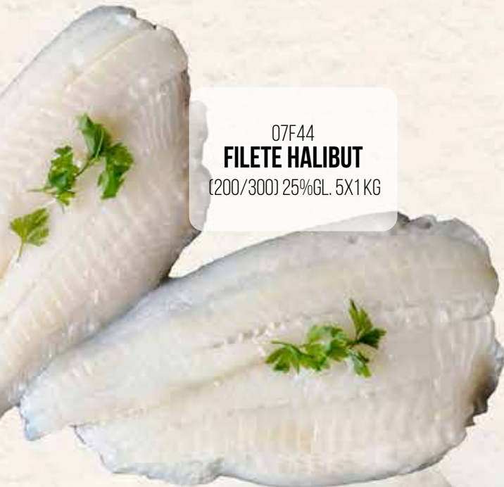
07F44 FILETE HALIBUT (200/300) 25%GL. 5X1 KG