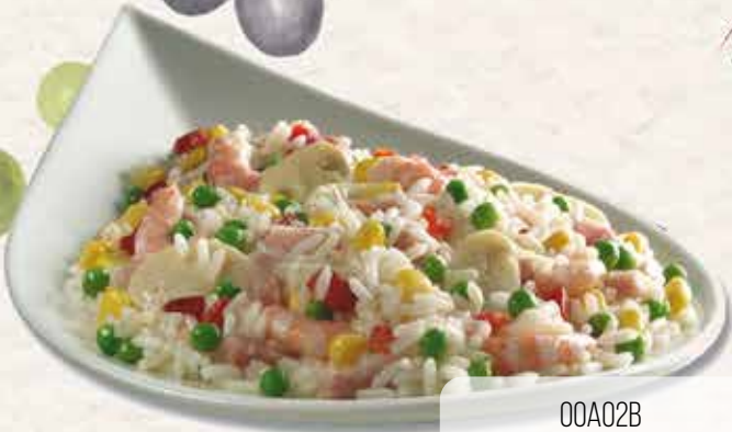
00A02B ARROZ 5 DELICIAS E.P. 4X2.5 KG