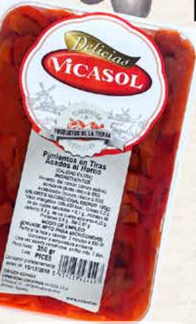
11PV3 PIMIENTO ROJO ASADO TIRAS 8X500 GR/UND