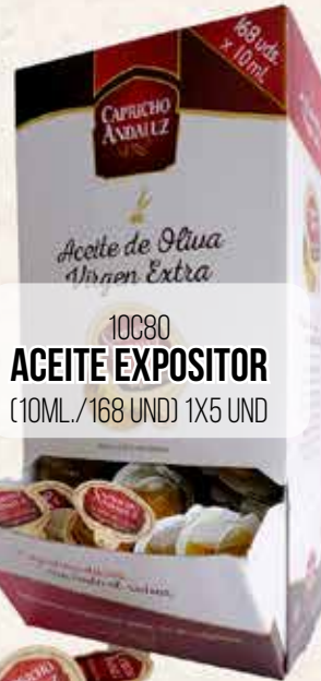
10C80 ACEITE EXPOSITOR (10ML./168 UND) 1X5 UND