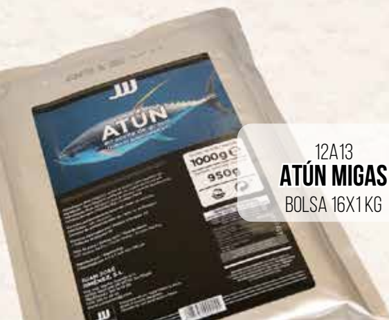
12A13 ATÚN MIGAS BOLSA 16X1 KG