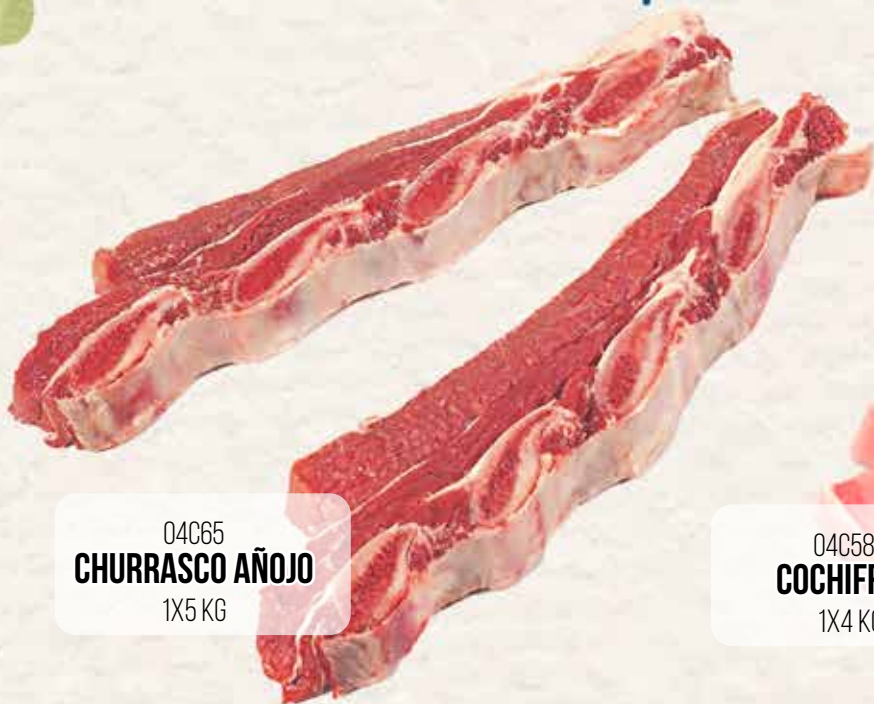
04C65 CHURRASCO AÑOJO 1X5 KG