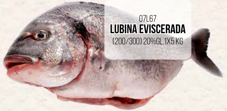
07L67 LUBINA EVISCERADA (200/300) 20%GL. 1X5 KG