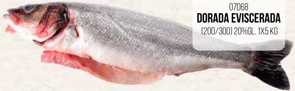
07D68 DORADA EVISCERADA (200/300) 20%GL. 1X5 KG