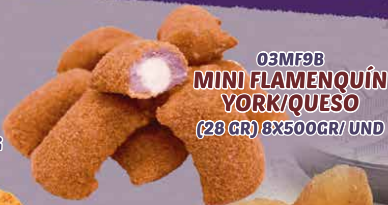
03MF9B MINI FLAMENQUÍN YORK/QUESO (28 GR) 8X500GR/UND