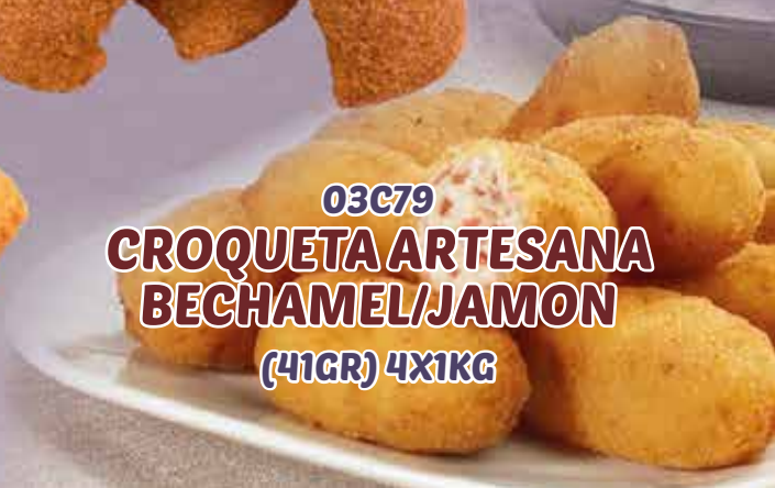
03C79 CROQUETA ARTESANA BECHAMEL/JAMON (41GR) 4X1KG