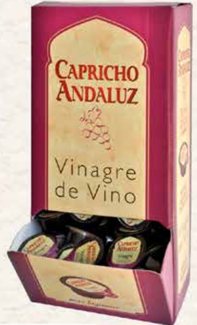
10C81B VINAGRE EXPOSITOR (10ML. /168 UND) 1X5 UND