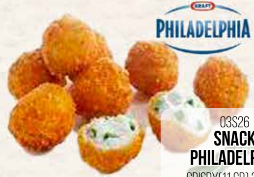
PHILADELPHIA 03S26 SNACK PHILADELPHIA CRISPY(11 GR) 3X1 KG