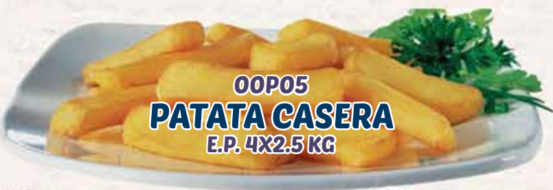
00P05 PATATA CASERA E.P. 4X2.5 KG