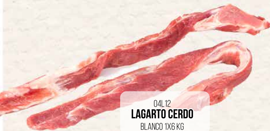
04L12 LAGARTO CERDO BLANCO 1X6 KG