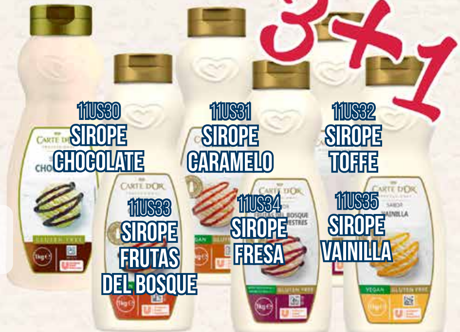
11US30 SIROPE CHOCOLATE