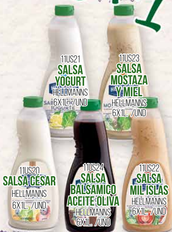
11US21 SALSA YOGURT HELLMANN'S 6X1L /UND