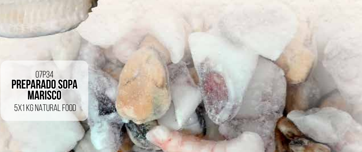
07P34 PREPARADO SOPA MARISCO 5X1 KG NATURAL FOOD