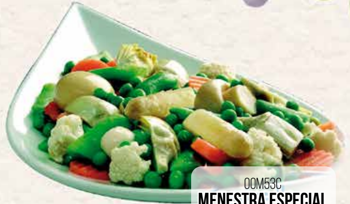
00M53C MENESTRA ESPECIAL E.P. 2X2.5 KG