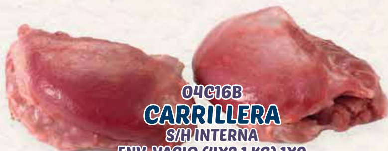
04C16B CARRILLERA S/H INTERNA ENV. VACIO (4X2,1 KG) 1X9 KG APROX