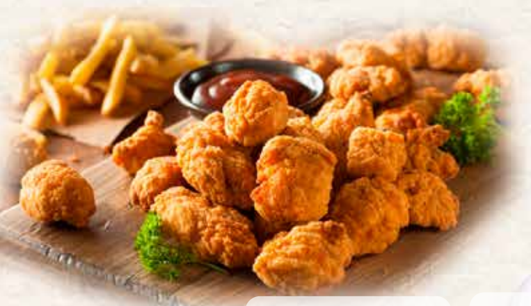
03C201 CHICKEN POPS PALOMITAS POLLO (12GR) 5X1KG