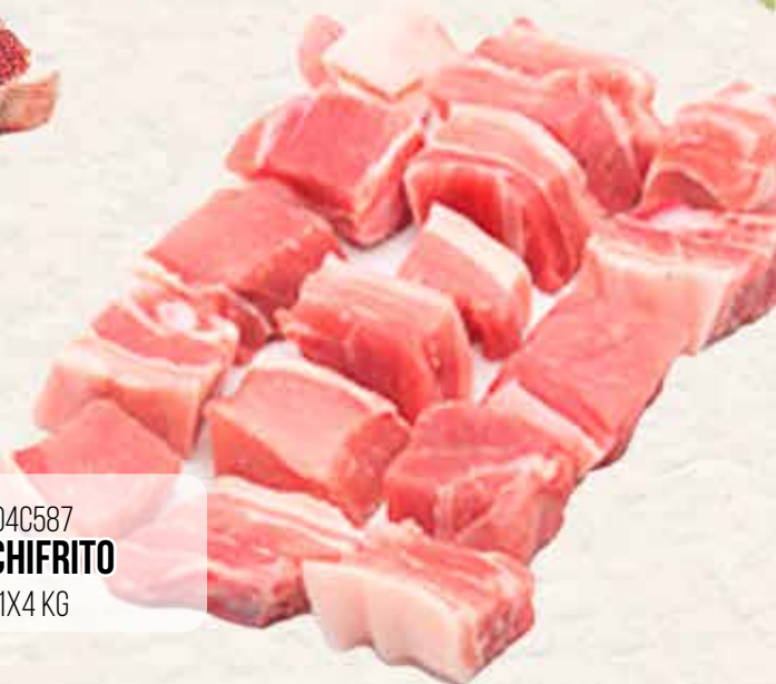
04C587 COCHIFRITO 1X4 KG