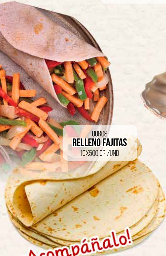
00R08 RELLENO FAJITAS 10X500 GR /UND