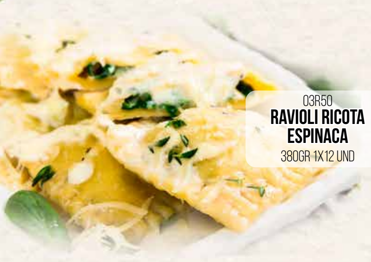
03R50 RAVIOLI RICOTA ESPINACA 380GR 1X12 UND