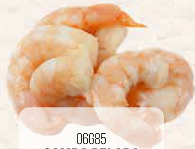
06G85 GAMBA PELADA (30/50) E.P.5X1 KG