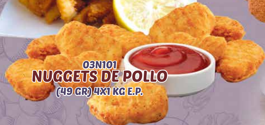
03N101 NUGGETS DE POLLO (49 GR) 4X1 KG E.P.