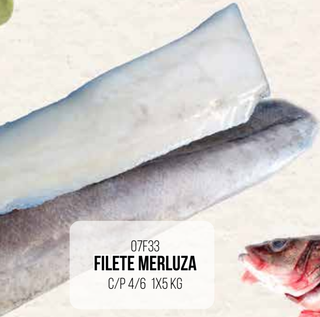
07F33 FILETE MERLUZA C/P 4/6 1X5 KG