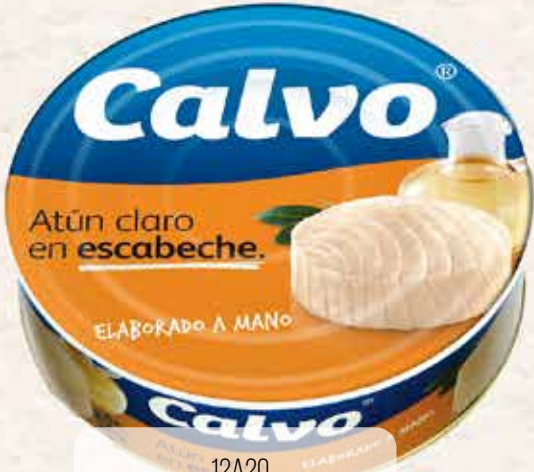
12A20 ATUN CLARO CALVO ESCABECHE (RO-1800) 1X8 UND