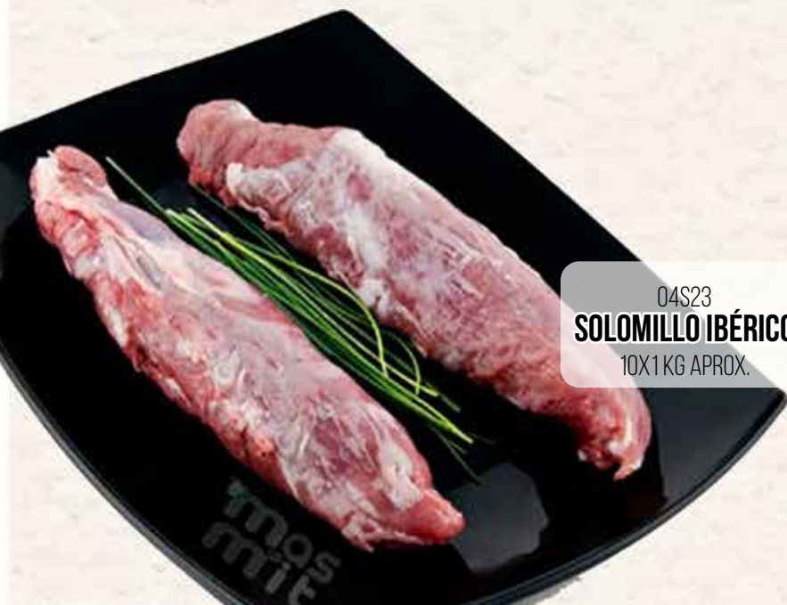
04S23 SOLOMILLO IBÉRICO 10X1 KG APPROX.