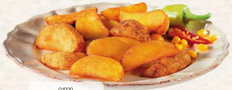
01P20 PATATA GAJO TEX-MEX LUT. 4X2.5 KG