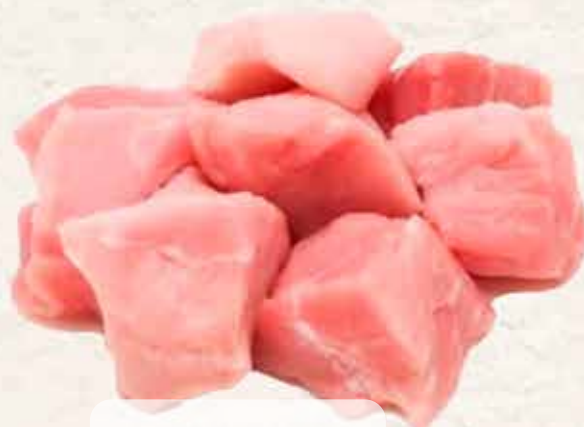
04T03 TACOS JAMÓN CERDO 1X5 KG