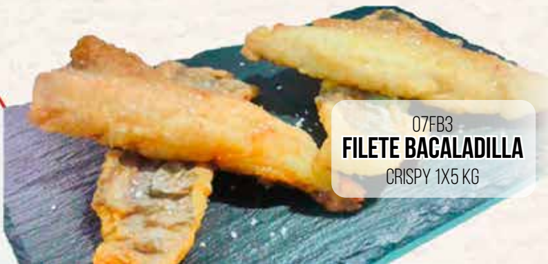
07FB3 FILETE BACALADILLA CRISPY 1X5 KG