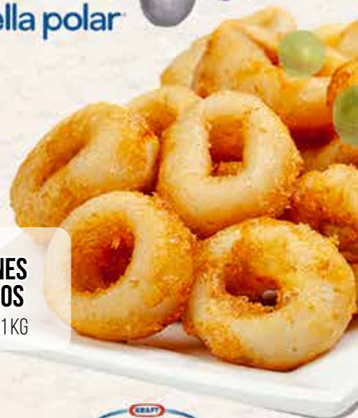
03C47 CHOPIRONES REBOZADOS AL HUEVO 4X1 KG