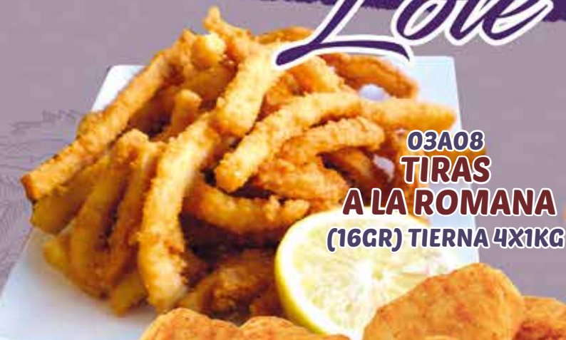
03A08 TIRAS A LA ROMANA (16GR) TIERNA 4X1KG