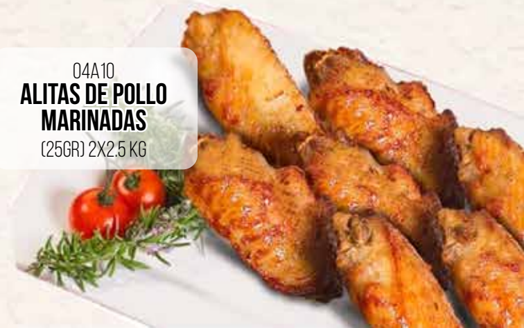
04A10 ALITAS DE POLLO MARINADAS (25GR) 2X2.5 KG