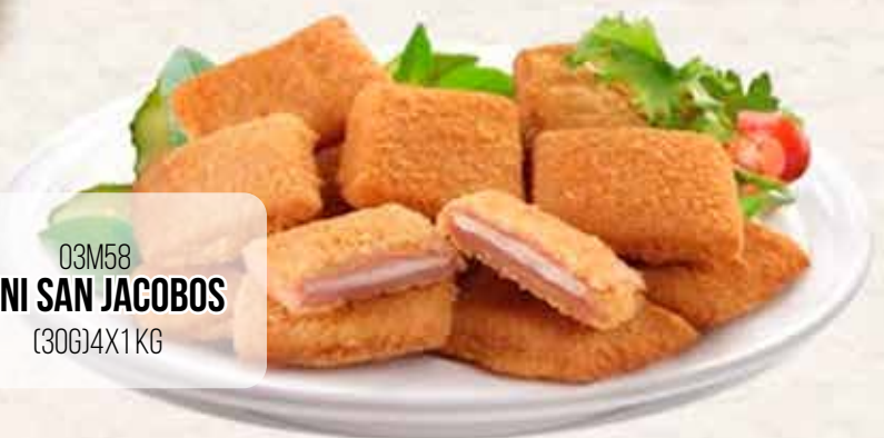
03M58 MINI SAN JACOBOS (30G)4X1 KG